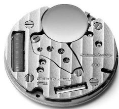
Jaeger-LeCoultre 积家 688 型机芯